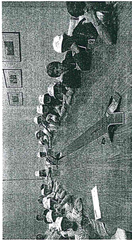
IN VIAGGIO I ragazzi della scuola media pistoiese durante la trasferta a Milano dove hanno ricevuto il riconoscimento internazionale